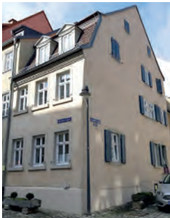
Geschäftsstelle Krumme Gasse 25 97421 Schweinfurt Tel. 09721-793 23 56 mail info@efsw.de www.efsw.de